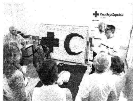
Fotografía de un momento del curso de Primeros Auxilios.

Por otro lado, dentro del programa de Intervención Familiar , cofinanciado por la Junta, se están organizando visitas y excursiones, entre otras a la Granja Escuela Monte-Júcar, de Montalvos.