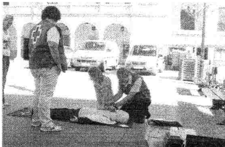
Cruz Roja interviene para enseñar sobre primeros auxilios.

«Damos refuerzo escolar a los niños vulnerables»