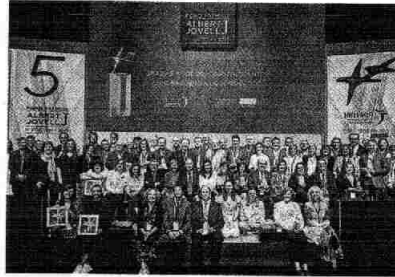
Imagen de familia de los ganadores.