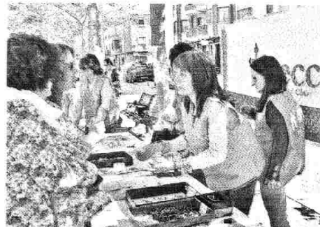
Voluntarias de la Asociación Española Contra el Cáncer, presente en la cita.