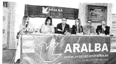
Un momento de la inauguración de las jornadas, celebradas este domingo.

La Asociación de Alcohólicos Rehabilitados, que recibió la felicitación del edil, celebró sus XXXVII Jornadas Locales y Municipales bajo el lema 'Volver a vivir'