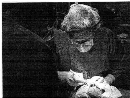
Un paciente con cáncer de piel durante una cirugía.

Aunque cada vez hay más concienciación e información acerca del cáncer de piel y de los riesgos de no protegerse del sol, todavía existen muchas falsas creencias. Por ejemplo, hay que saber que las cremas solares sí caducan y pierden sus propiedades pasados los 12 meses; la población debe saber que con una aplicación del fotoprotector no es suficiente; el tiempo de protección del fotoprotector no es infinito, por eso hay que volver a aplicarse la crema solar como mínimo cada dos horas; es muy importante evitar la exposición solar en las horas centrales del día y tomar otras protecciones como hacer uso de la sombrilla en la playa; la crema solar resistente al agua no garantiza la protección tras el baño, como tampoco el maquillaje con protección sustituye al protector solar.