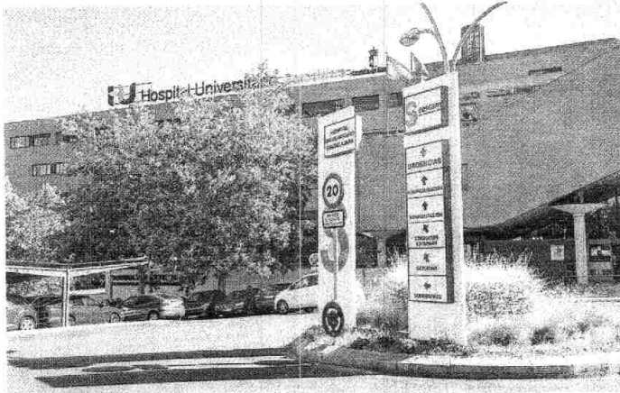
El servicio de cirugía plástica del Hospital de Guadalajara es el que registra una mayor demora en toda la región.

En la segunda posición aparece el Hospital General de Tomelloso, con 1.090 pacientes más, situándose