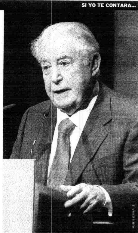
SI YO TE CONTARA...