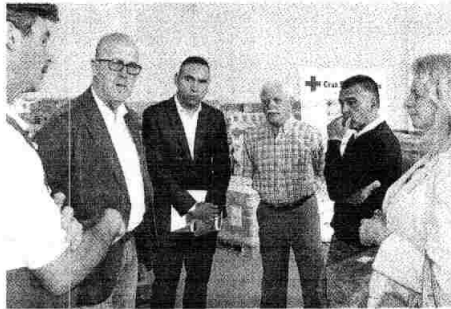
Un instante de la visita al almacén donde Cruz Roja clasifica los alimentos.

En esta primera fase, el Gobierno de España ha adquirido 96,4 mi-