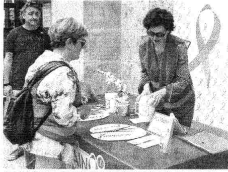
Una ciudadana deposita su donativo en una hucha de Acepain.

De hecho, el doctor Ocaña confió en que el primer fármaco aprobado en Estados Unidos para combatir a través de la inmunoterapia el cáncer de mama triple negativo, uno de los más mortíferos y agresivos, se pueda comercializar dentro de un año en España.