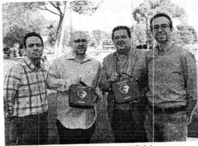
Los profesionales implicados en este proyecto, con desfibriladores.

Tal y como explican los profesionales del Servicio de Cardiología, cada año los eventos de paro cardíaco se cobran miles de vidas. En Albacete, cada año se producen 100 muertes súbitas. Iniciar la RCP básica rápidamente puede multiplicar hasta por cuatro las posibilidades de sobrevivir a una parada cardiorrespiratoria y, sin embargo, estas maniobras solo se aplican en un 10 por ciento de las paradas cardiorrespiratorias presenciadas por población general. Es por ello que se está desarrollando este ambicioso proyecto con la intención de abarcar a la mayor parte de la sociedad albacetense con formación acreditada.