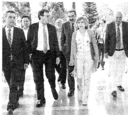
Carcedo, junto al resto de autoridades, inauguró las Jornadas.

En su intervención María Luisa Carcedo se ha referido a indicadores, como la obesidad y el sobrepeso infantil, o como las familias pobres consumen más alimentos azucarados o procesados, lo que representa un «coste social evidente a largo plazo» al implicar obesidad de adultos o enfermedades como la diabetes. Frente a esto, ha planteado acciones que se pueden impulsar: desde lo público, como los programas de comedores escolares ligados a actividades extraescolares, y por tanto, sin «estigma social». Sobre su continuidad al frente del Ministerio, Carcedo ni confirmó ni desmintió, señalando que eso es algo que dependerá del Gobierno y que estará donde su partido decida, aunque reconoció que queda mucho trabajo por hacer en su Departamento.