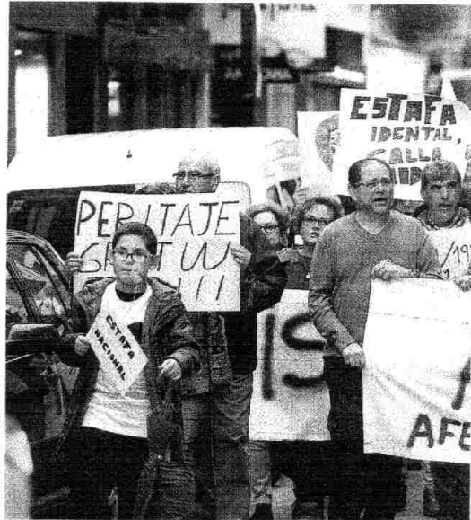
Imagen de una de las protestas de los usuarios de iDental por las calles.

Hasta la fecha se han cerrado sin acuerdo o con mediación desfavorable 77 reclamaciones, la mayoría