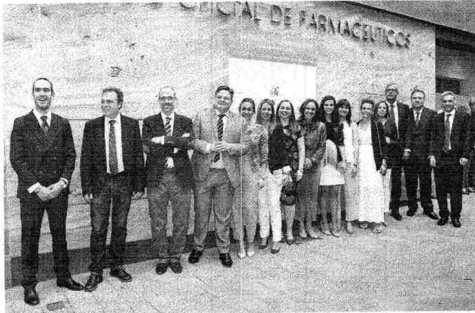
Fotografía de familia de la nueva Junta de Gobierno del COF con representantes institucionales a las puertas de la sede.