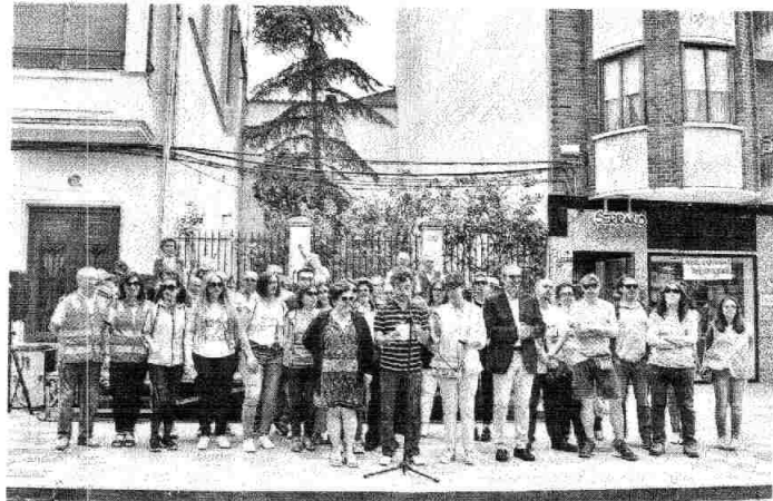
Representantes de los distintos colectivos y del Consistorio, en la inauguración de la Feria. / N.A.

El responsable de Participación Ciudadana quiso agradecer su colaboración a todas las asociaciones participantes, ya que son las protagonistas de esta actividad y al tiempo son el motor de la misma, puesto que son las asociaciones las que